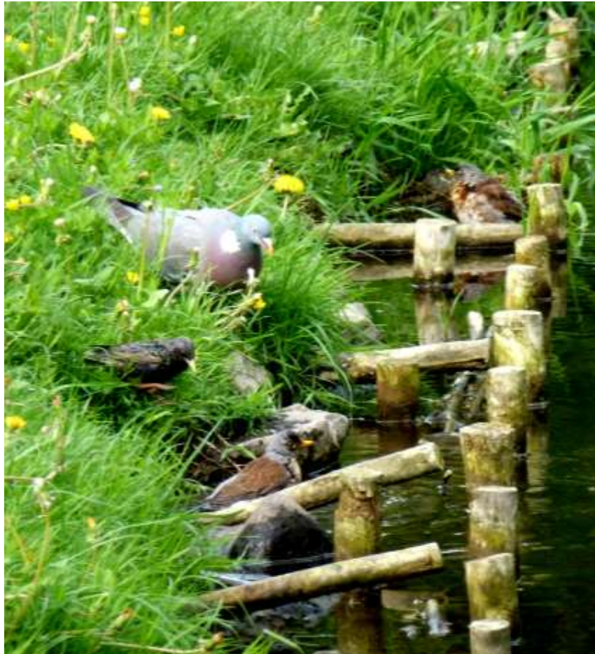
Grzywacz, szpak i dwa kwiczoły

Na stronach poświęconych poszczególnym gatunkom kilka razy pojawił się, obok pokazywanego, ptak innego gatunku. Sceną zbiorową nazwałem scenkę z ptakami co najmniej trzech gatunków. Tutaj dwie scenki trójkowe.