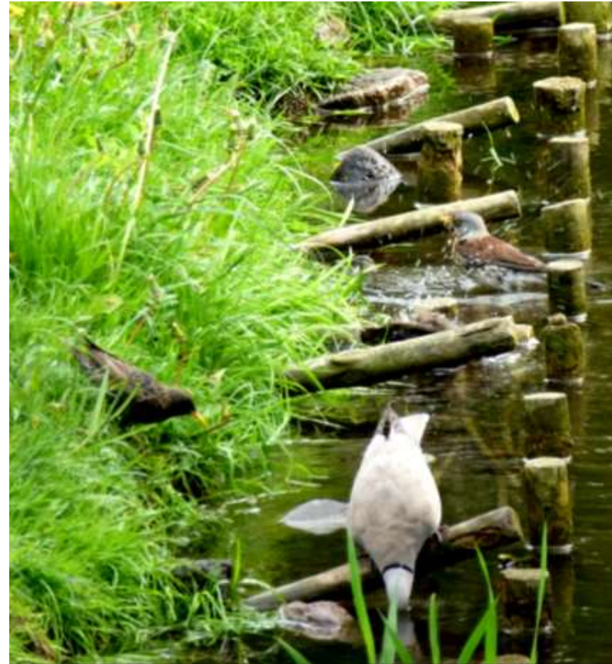
Szpak, kwiczoł i sierpówka