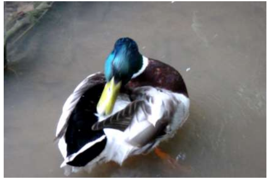
Krzyżówki na Rubinkowie